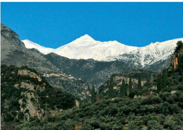
Η κορυφή του Ταυγέτου από την Καρδαμύλη