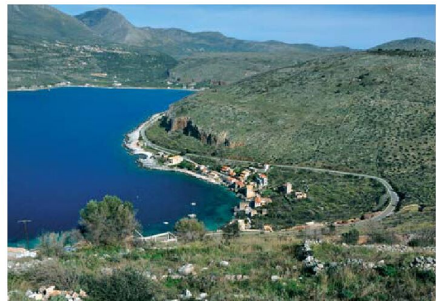
Το Λιμένι και στο βάθος το Οίτυλο