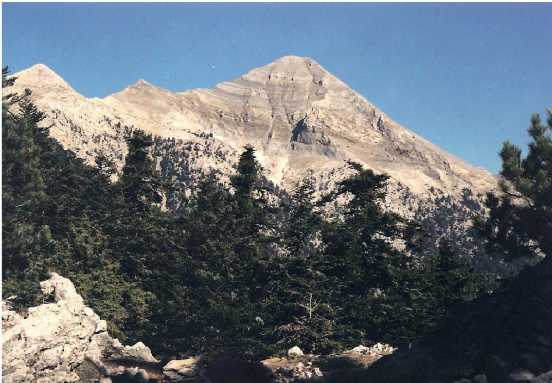
Η κορυφή Προφήτης Ηλίας του Ταΰγету, από το δάσος της Βασιλικής...