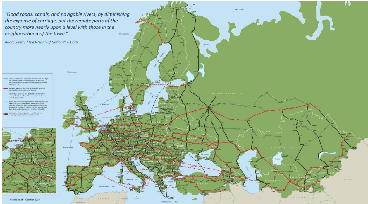
Εικόνα 1: Κύριες Διεθνείς Ευρωπαϊκές Αρτηρίες (AGR, 1975)