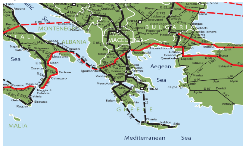
Εικόνα 2: Απόληξη Διευρωπαϊκών Οδικών Δικτύων στην Ελλάδα

Όπως φαίνεται στη σελίδα 18 Annex I της Συνθήκης, η Ευρωπαϊκή Αρτηρία E 65 ξεκινά από το Μαλμϋ Σουηδίας και καταλήγει στον Κίσσαμο και Χανιά Κρήτης μέσω Καλαμάτας, διασχίζοντας 10 Ευρωπαϊκές χώρες. Οι