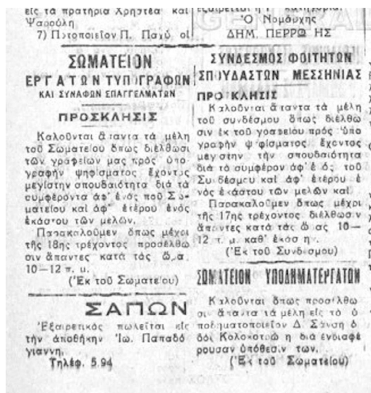
«Τα Νέα-Θάρρος-Σπμαία» 16/2/1944 - «Βιομηχανία» ανακοινώσεων σωματείων κατά των... αναρχικών