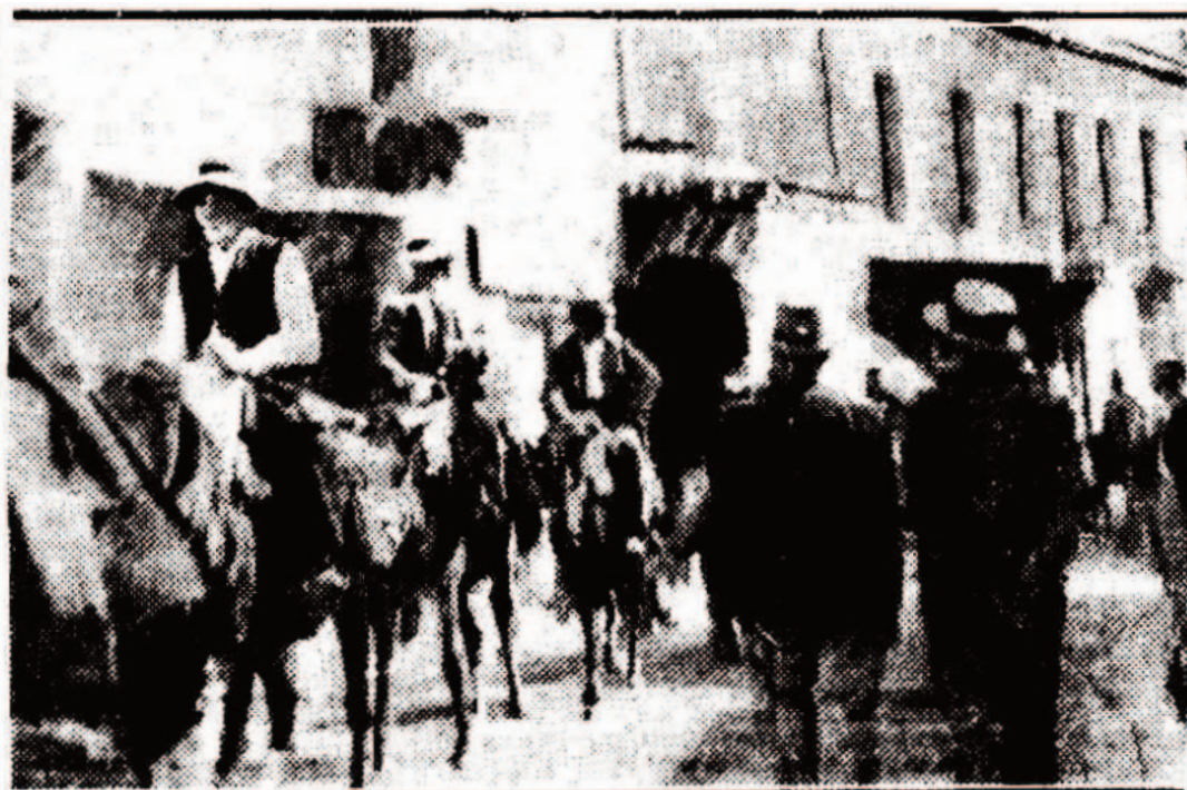
ΑΠΟ ΤΑ ΧΑΡΑΜΑΤΑ ΑΚΟΜΗ, ΟΙ ΣΤΑΦΙΔΟΠΑΡΑΓΩΓΟΙ εισήρχοντο χθές ἔφιππει εἰς τὸ Αἴγιον, διὰ νὰ μετασχευοῦν εἰς τὸ συλλαλητήριον.