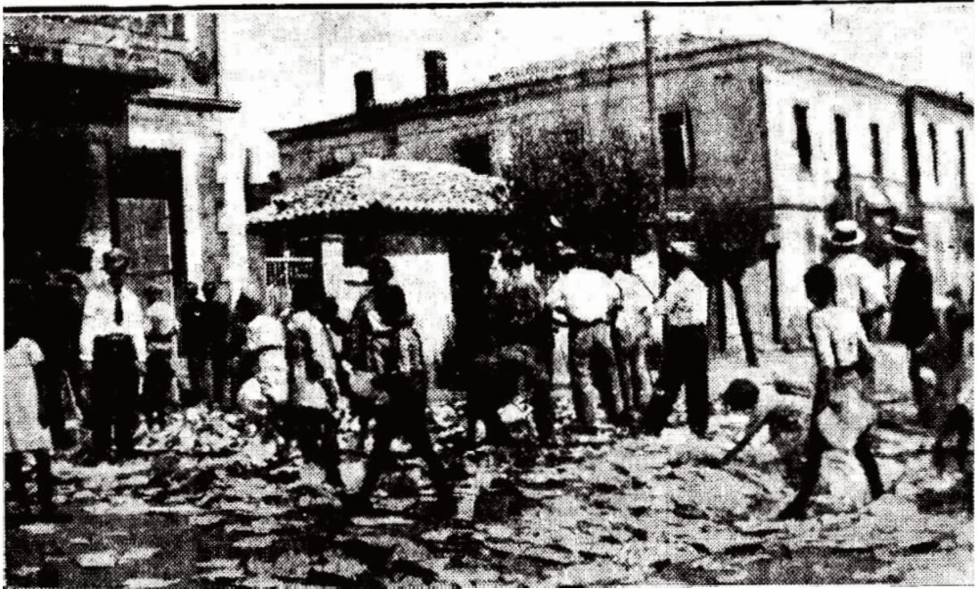
Αίγιο – “Ελεύθερος Ανθρωπος” 27/8/1934

από μίαν ασθενή κυβέρνηση, η οποία αγωνίζεται σήμερα να περισώσει ψυχία. Αξιος ο μισθός των. Αλλά με τας φωνάς, τας διαμαρτυρίας και τας παραλόγους αξιώσεις των μου ενθυμίζουν την γνωστή παροιμίαν του κατοικιδίου εκείνου ζώου που του αρέσει να κάμνει ρομαντικούς περιπάτους εις τας στέγας των οικιών.