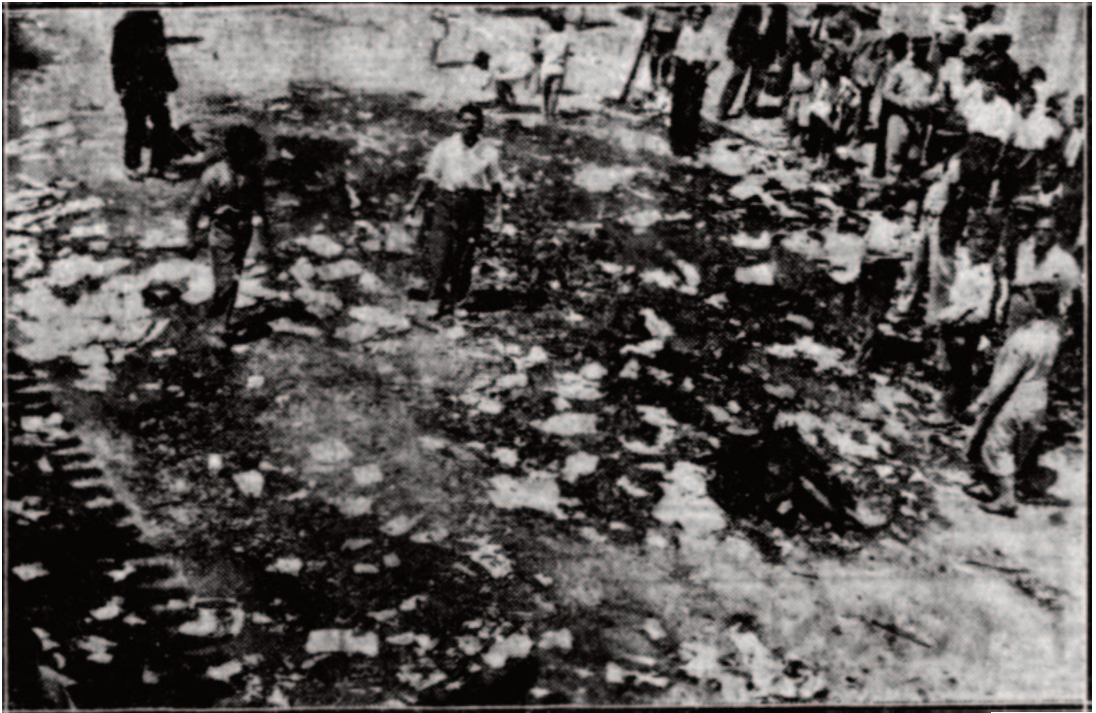
Αίγιο – “Ακρόπολις” 27/8/1934

ΑΣΟ (Γενικών Αποθηκών) κειμένων επί της λεωφόρου Μπτροπόλεως άνωθεν του Δημαρχείου και φρουρουμένων υπό στρατού και χωροφυλακής, εξέσπασαν εις ζωηράς αποδοκιμασίας.