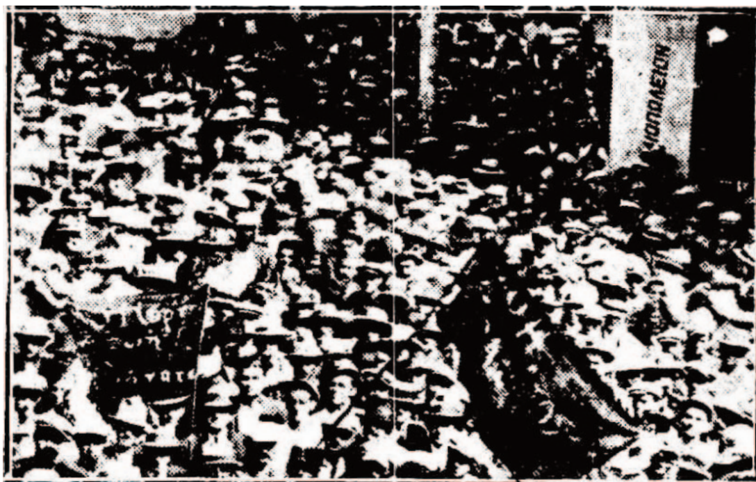
ΜΙΑ ΦΩΤΟΓΡΑΦΙΑ ΑΠΟ ΤΟ ΠΡΟΧΘΕΣΙΝΟΝ ΣΥΛΛΑΛΗΤΗΡΙΟΝ ΤΟΥ ΠΥΡΓΟΥ. Οί σταφιδοπαρκαγωγοί συγκεντρώνονται με κύριον σημαίον.