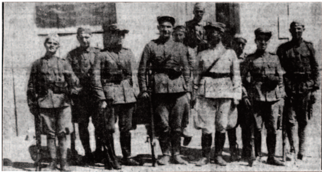
Αίγιο - "Ακρόπολις" 27/8/1934

προσδοκίας της, ότι δίκαια αιτήματά της, των οποίων η μεγάλη επιτροπή επαρχιών καλών ποιοτήτων επεζήτησεν επιτυχίαν θα ελαμβάνοντο υπ' όψει, κατήλθε σήμερα πόλιν Αιγίου εν εξεγέρσει, παρασύρουσα τα πάντα. Η απώλεια πάσης ψυχραιμίας εκ μέρους των οργάνων της τάξεως, άτινα ήρχισαν πυροβολούντα ομάδα ζωηρών διαδηλωτών, είνε η αιτία τραυματισμού τριών αθών πολιτών εξών δύο βαρέως. Επιστώντες υμετέραν προσοχήν επί θλιβερών γεγονότων και ζητούντες αυστηράν τιμωρίαν υπευθύνων, επιθυμούμεν δηλώσωμεν υμίν ότι τα ανωτέρω αποτελούσιν απλούν προανάκρουσμα και ότι παρίσταται ανάγκη όπως λαμβάνοντες υπ' όψει δικαίαν εξέγερσιν δουλεύοντος σκληράν δουλείαν κόσμου παραγωγών καλών ποιοτήτων, ευαρεστηθήτε αντιμετωπίσπε ζήτημα και προωθήσπε τούτο, πριν ή η απόγνωσις του λαού δημιουργήσζητήματα τάξεως.