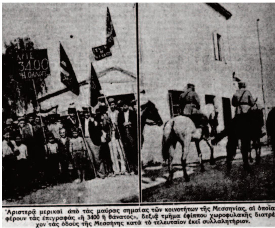
‘Αριστερά μερικά από τας μαύρας σημαίας των κοινοτήτων της Μεσσηνίας, αι όποιαι φέρουν τας έπιγραφάς «ή 3400 ή θάνατος». Δεξιά τμήμα έφιππου χωροφυλακής διατρέχον τας όδους της Μεσσηνίας κατά τó τελευταίον εκεί συλλαλητήριον.