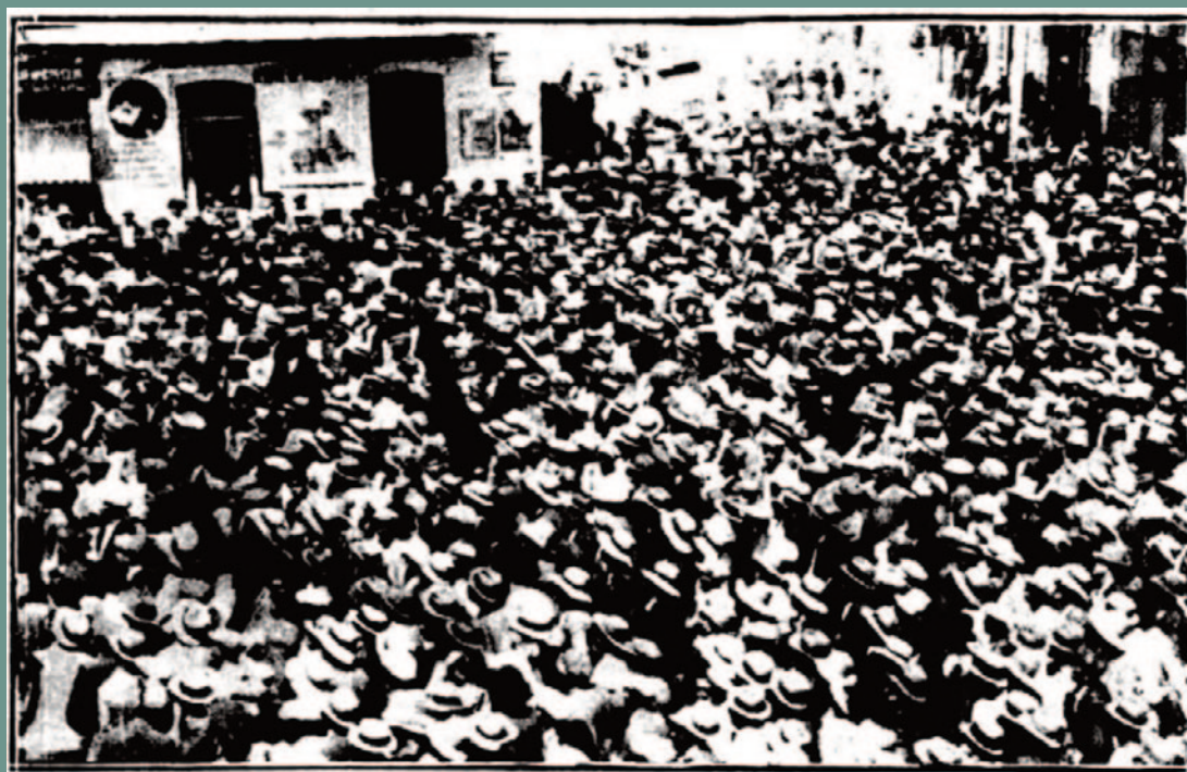
Μεγάλο συλλαλητήριο στον Πύργο υπέρ του παρακρατήματος και σύνθημα «3.600 ή θάνατος» την ίδια ημέρα με το συλλαλητήριο του Αιγίου